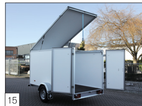
15 Option: aufklappbarer Deckel an der Vorderseite (möglich bis zu einer Größe von max. 300 x 150 x 180 cm).