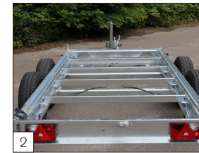
2 Standard: vollverschweißte und verzinkte Rahmen, die für alle Tandemachs-Versionen bis 3500 kg Zulässiges Gesamt Gewicht geeignet ist.