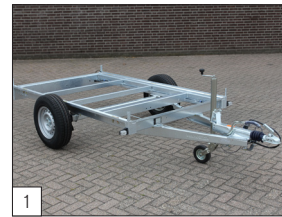
1 Standard: robustes Fahrwerk, die für alle einachsigen Versionen bis einschließlich 1800 kg Zulässiges Gesamt Gewicht geeignet ist.