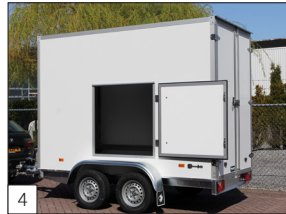
4 Option: Tür in der Seitenwand.