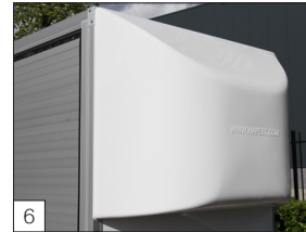
6 Option: Spoiler (Polyester) an der Vorderseite angebracht.