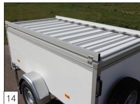
14 Option: Aluminium-Dachträger.