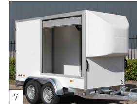
7 Option: Aluminium-Schiebelade in der Seitenwand.