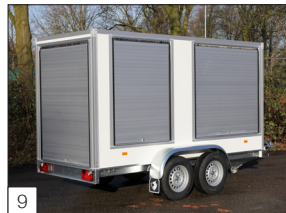
9 Option: Aluminium-Aufroll-Rolläden auf der Rückseite und Schiebeläden an den Seiten.