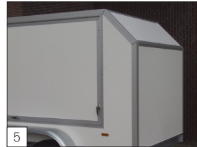
5 Option: abgeschrägte Front (gleicher Winkel von etwa 40 x 40 cm).