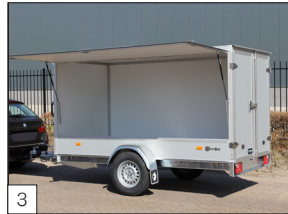
3 Option: Seitenklappe montiert, kann sowohl links als auch rechts (in Fahrtrichtung) angeordnet werden.