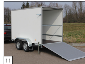
11 Option: Heckklappe mit grauer Anti-Rutsch-Beschichtung versehen.