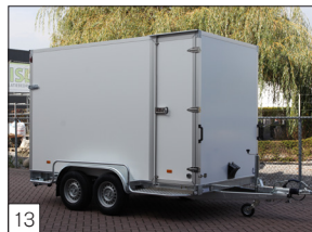
13 Option: Seitentür mit Scharnieren und Verschlüssen aus Edelstahl.