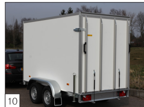
10 Option: Heckklappe mit Gasdruckfedern und doppeltem Verschluss links und rechts.