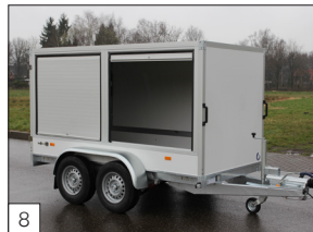
8 Option: 2 Aluminium-Schiebeläden (maximal 150 cm breit) in der Seitenwand inkl. Mittelpfosten.