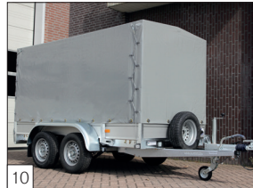
Option : bâche montée et roue de secours avec support à l'avant.