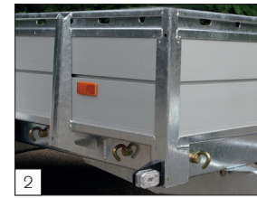
Option : crochets boulonnables sur la partie extérieure.