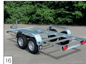
Option : châssis modèle L-2, avec comme option supplémentaire la possibilité d'installer un plancher en multiplex.