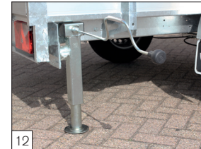
Option : béquilles réglables et pivotantes et équipées d'une manivelle amovible.