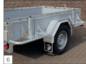
Option : supports de protection devant, au-dessus et derrière les garde-boue (en une seule pièce) et plaque d'appui en aluminium. Garde-boue en robuste tôle d'aluminium.