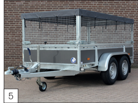
Option : rehausse grillagée de 700 mm de haut (amovible) et filet d'arrimage en fines mailles (monté).