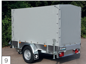
Option : bâche montée, différentes hauteurs possibles avec béquilles et clé de coulissement.