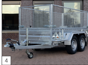
Option : panneaux en acier galvanisé, garde-boue robuste en aluminium, grillage amovible et supports de protection monté en une seule pièce.