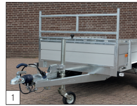
De série : porte-échelle amovible.