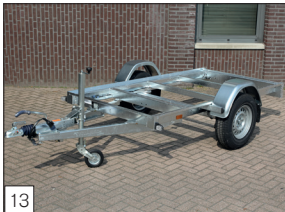
Option : châssis modèle L-1, disponible en version freinée et non freinée.