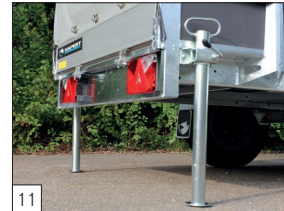
Option : béquilles coulissantes avec support de clé.