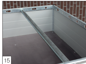
Option : barre télescopique.