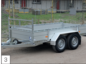
Option : garde-boue en tôle d'aluminium striée.