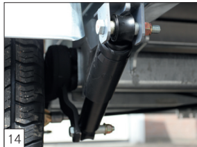
Option : amortisseurs sur l'essieu ou les essieux.