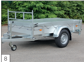
Option : bâche plate montée (de couleur grise).