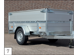
Option : rehausse en aluminium amovibles d'environ 40 cm de haut, équipées de fermetures solides.